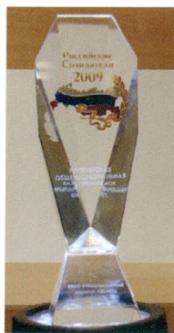
Знак лауреата Российской общенациональной премии «Российские создатели» (2009 г)

Направления деятельности ВЕМО разнообразны. Это и все виды инженерно-технического аудита, строительной экспертизы, технических и энергетических обследований в промышленности, ЖКХ, ВПК, АПК на предприятиях и организациях ТЭК и Минобороны; инженерно-техническое сопровождение строительства, создание и внедрение технологий неразрушающего контроля качества и остаточного ресурса строительных конструкций и промышленного оборудования; разработка и комплектация мобильных лаборато-