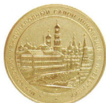
Золотая медаль лауреата инновационного форума (2010 г).