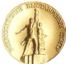
Золотая медаль лауреата ВВЦ (2007, 2009 гг)